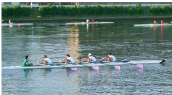
部活動の様子 (戸田中学校ボート部)

議員 具体的な支援内容は。教育部長 スポーツトレーニングによる効率的・効果的なトレーニングの実践や、トレーナーによる訪問指導等を盛