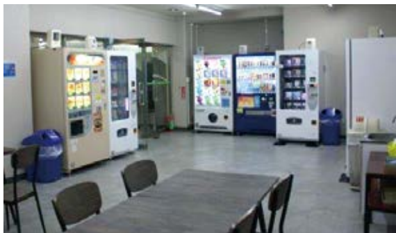
売店跡に設置された自動販売機コーナー

議員 国や各自治体で給付型奨学金制度への見直しを始めている。半額返済も含め、戸田市での奨学金制度の見直しを強く要望する。