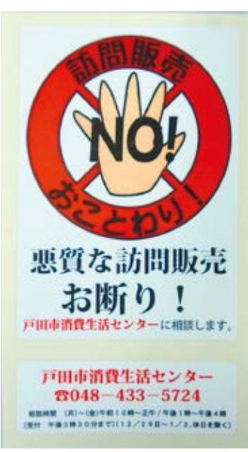
戸田市も登録制度をつくってみたい

議員 国や各自治体で給付型奨学金制度への見直しを始めている。半額返済も含め、戸田市での奨学金制度の見直しを強く要望する。